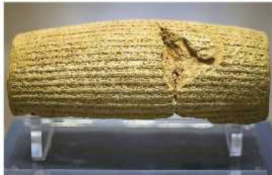
منشور کوروش که در حال حاضر در کشور انگلیس نگهداری می‌شود و پژوهشگران موفق به خواندن آن شده‌اند.

نکته در دوره کوروش و داریوش، قلمرو جغرافیایی هخامنشیان بیشتر کشورهای مهم آن روز را در بر می‌گرفت؛ به همین دلیل می‌توان از حکومت هخامنشی به عنوان نخستین امپراتوری جهانی یاد کرد.