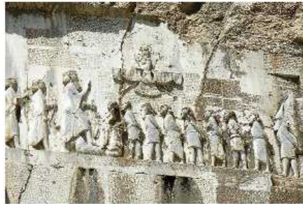
کتیبه داریوش هخامنشی در بیستون