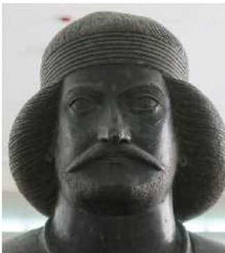
مجسمه مرد پارتی (اشکانی)

یکی دیگر از اقوام آریایی، پارت‌ها بودند.